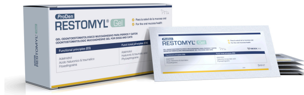
Envase Clínico 50ml (10x5ml)